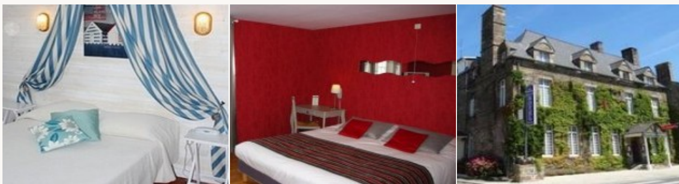
Voorbeeld van het type accommodatie

U overnacht in **type hotels die alle comfort bieden na een dag in de buitenlucht. Deze familie hotels zijn gezinsvriendelijke. Het ontbijt is inbegrepen.