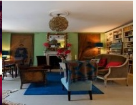
Voorbeeld van het type accommodatie