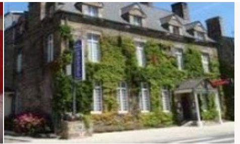
Voorbeeld van het type accommodatie