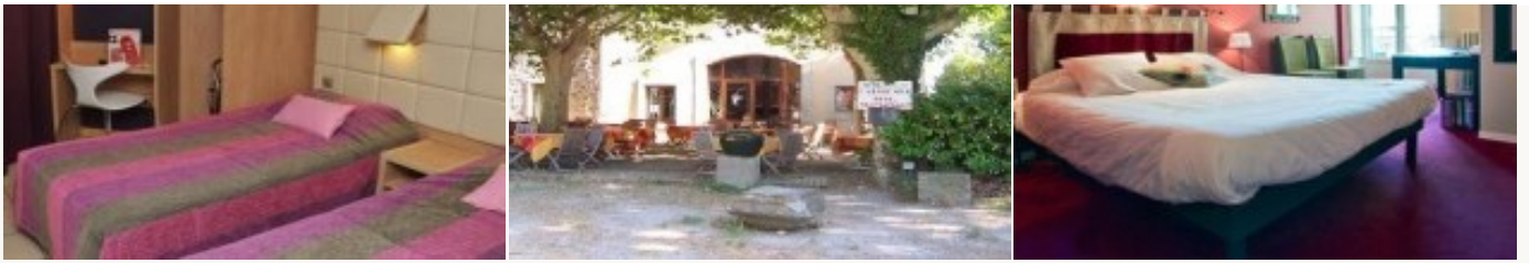
* Unterkunftbeispiel der Kategorie entsprechend