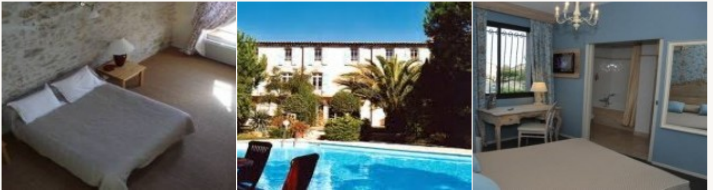
* Unterkunftbeispiel der Kategorie entsprechend

Übernachtung in Hotels auf *** Niveau oder Pensionen, die aufgrund ihres hohen Qualitätsstandards und ihres herzlichen Empfangs ausgesucht worden sind. Das Frühstück ist miteinbegriffen.