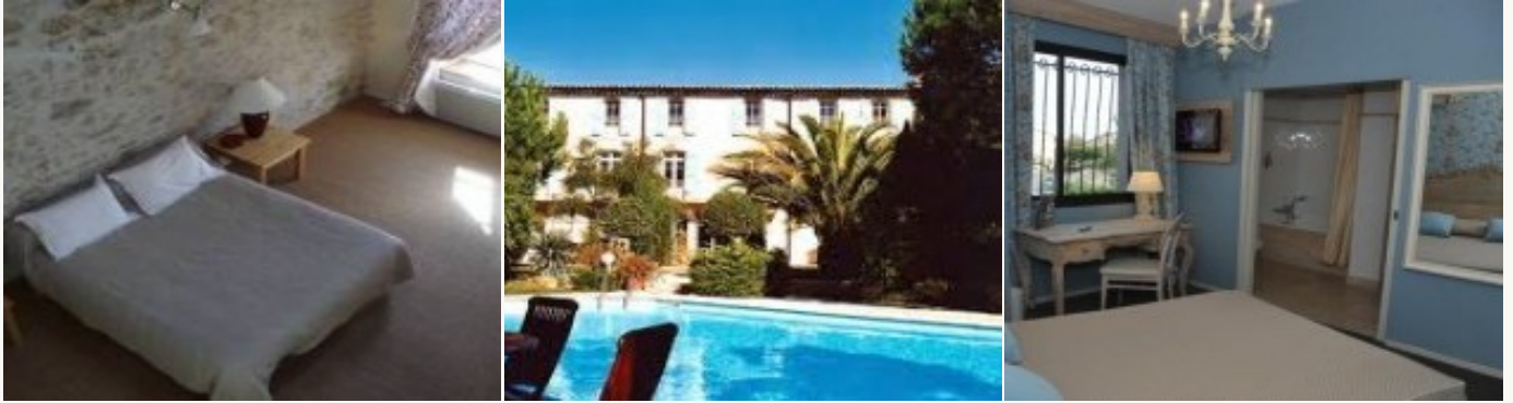
* Unterkunftsbeispiel der Kategorie entsprechend

Übernachtung in Hotels auf *** Niveau oder Pensionen, die aufgrund ihres hohen Qualitätsstandards und ihres herzlichen Empfangs ausgesucht worden sind. Das Frühstück ist miteinbegriffen.