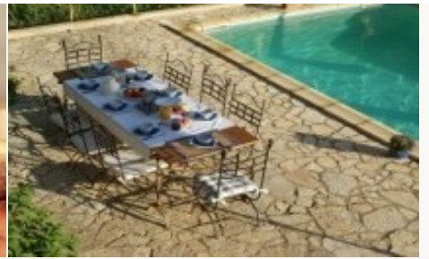
* Unterkunftsbeispiel der Kategorie entsprechend