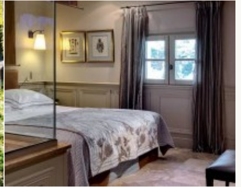
* Unterkunftsbeispiel der Kategorie entsprechend