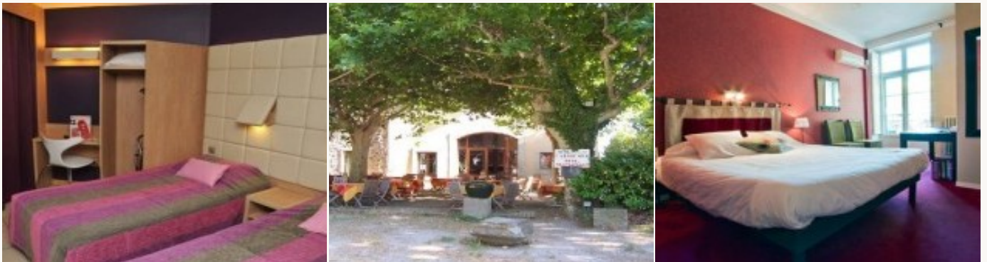
Voorbeeld van het type accommodatie

U overnacht in **type hotels die alle comfort bieden na een dag in de buitenlucht. Deze familie hotels zijn gezinsvriendelijke. Het ontbijt is inbegrepen.