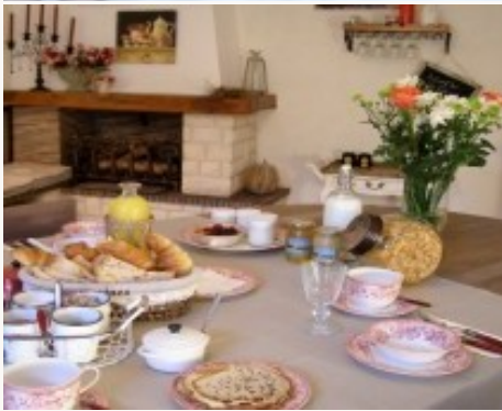
Voorbeeld van het type accommodatie