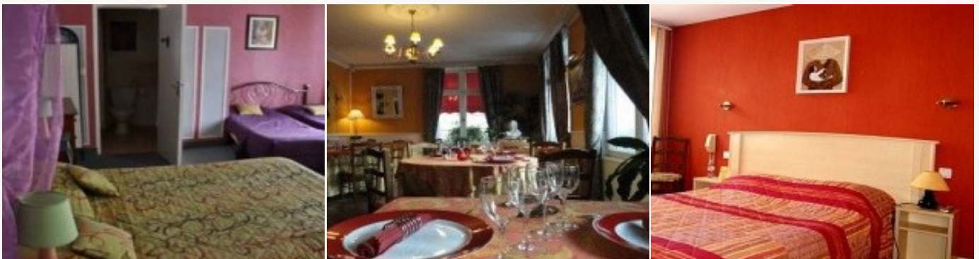
Voorbeeld van het type accommodatie

U overnacht in **type hotels die alle comfort bieden na een dag in de buitenlucht. Deze familie hotels zijn gezinsvriendelijke. Het ontbijt is inbegrepen.