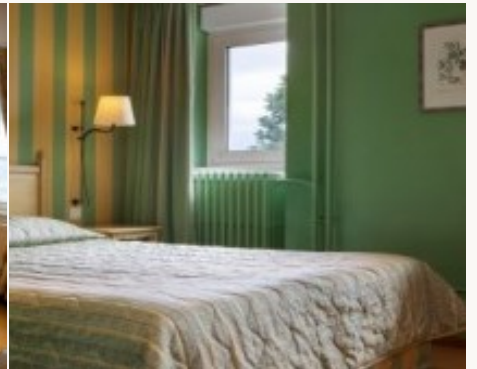
* Unterkunftbeispiel der Kategorie entsprechend