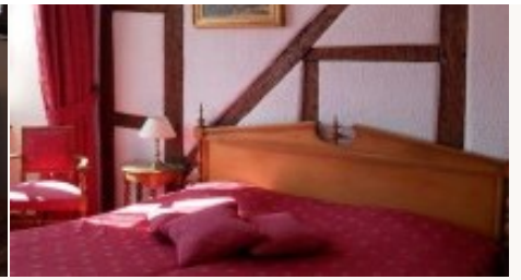
* Unterkunftbeispiel der Kategorie entsprechend