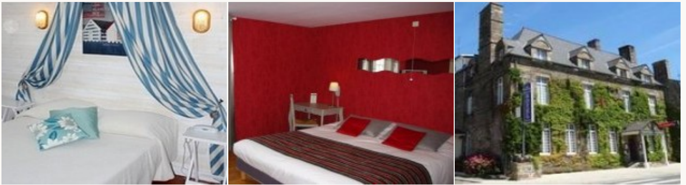
* Unterkunftsbeispiel der Kategorie entsprechend

Übernachtung in familiengeführte Hotels auf ** Niveau. Diese stellen den nötigen Komfort nach einem Tag an der frischen Luft bereit und empfangen Sie herzlich. Das Frühstück ist miteinbegriffen.