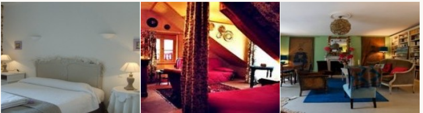
* Unterkunftsbeispiel der Kategorie entsprechend

Übernachtung in Hotels auf *** Niveau oder Pensionen, die aufgrund ihres hohen Qualitätsstandards und ihres herzlichen Empfangs ausgesucht worden sind. Das Frühstück ist miteinbegriffen.