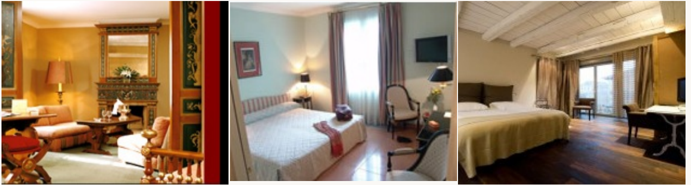
* Unterkunftbeispiel der Kategorie entsprechend

Übernachtung in Hotels auf ***/** Niveau, die aufgrund ihres hohen Qualitätsstandards und ihres herzlichen Empfangs ausgesucht worden sind. Das Frühstück ist miteinbegriffen.