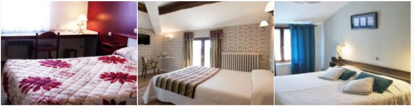
Voorbeeld van het type accommodatie