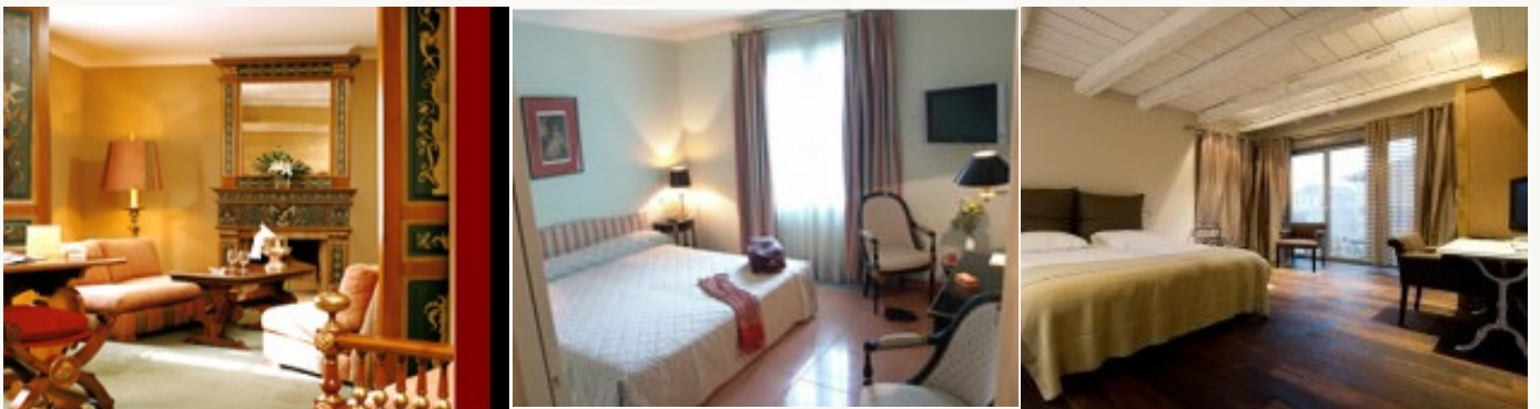
Voorbeeld van het type accommodatie

U logeert in ***/****type hotels, die voor de kwaliteit en het warme onthaal werd geselecteerd. Het ontbijt is inbegrepen.