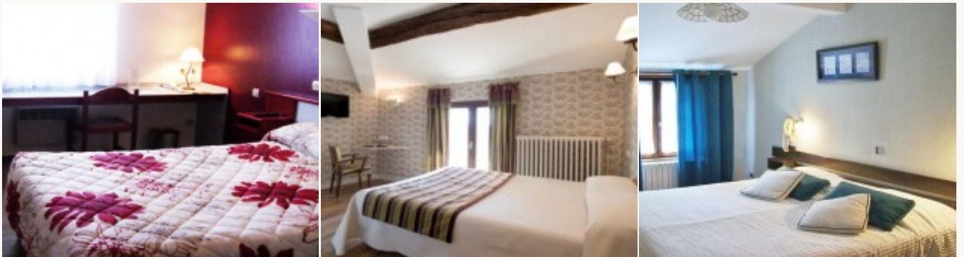
Voorbeeld van het type accommodatie

U overnacht in **/** type hotels die alle comfort bieden na een dag in de buitenlucht. Deze familie hotels zijn gezinsvriendelijke. Het ontbijt is inbegrepen.