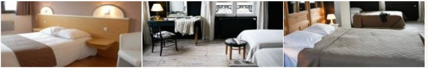
Voorbeeld van het type accommodatie