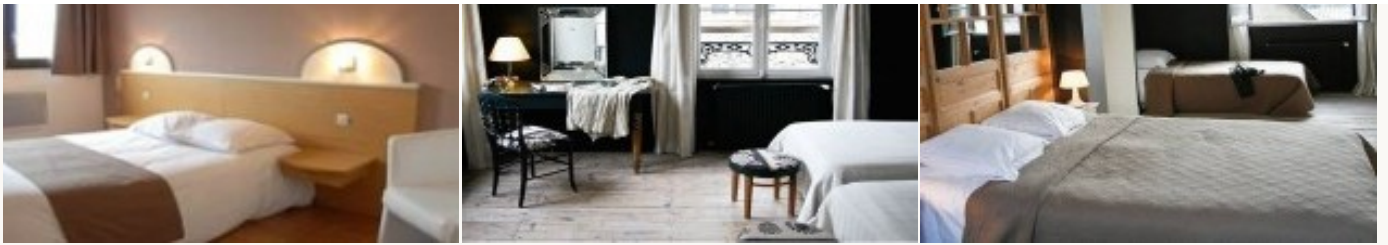
* Unterkunftbeispiel der Kategorie entsprechend