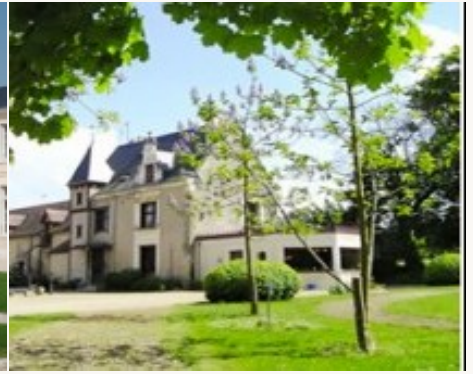
* Unterkunftbeispiel der Kategorie entsprechend