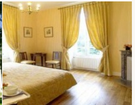
* Unterkunftbeispiel der Kategorie entsprechend