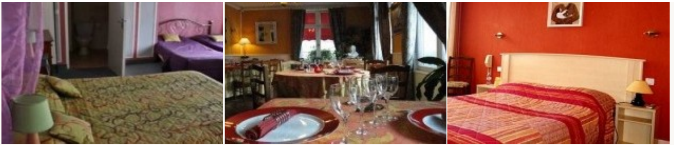
* Unterkunftbeispiel der Kategorie entsprechend