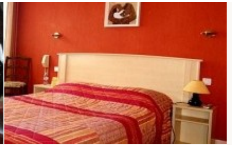
* Unterkunftbeispiel der Kategorie entsprechend