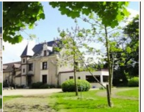
* Unterkunftbeispiel der Kategorie entsprechend