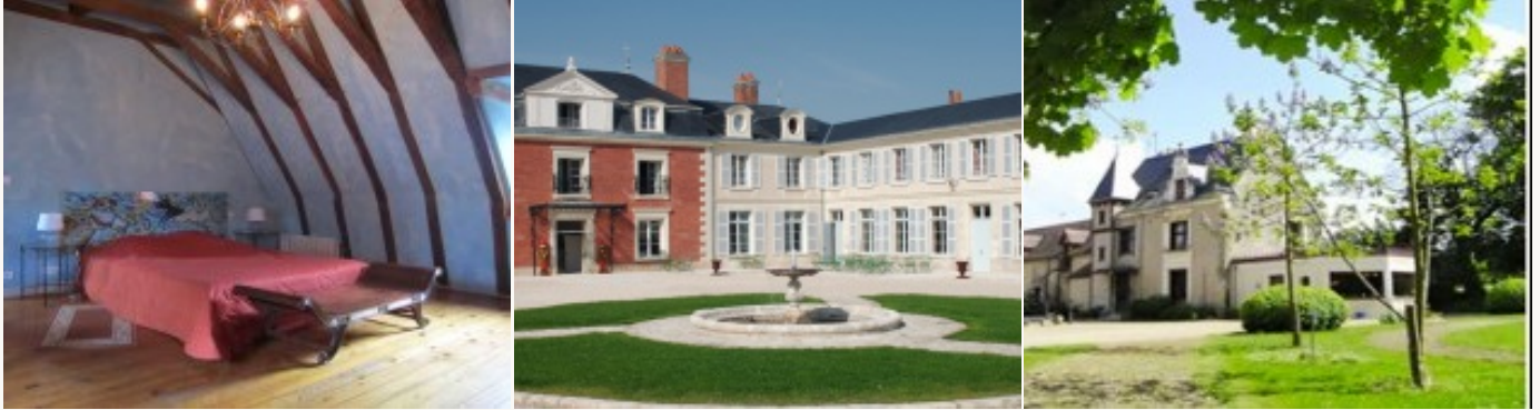
* Unterkunftsbeispiel der Kategorie entsprechend

Übernachtung in Hotels auf *** Niveau oder Pensionen, die aufgrund ihres hohen Qualitätsstandards und ihres herzlichen Empfangs ausgesucht worden sind. Das Frühstück ist miteinbegriffen.