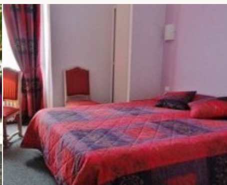
Voorbeeld van het type accommodatie