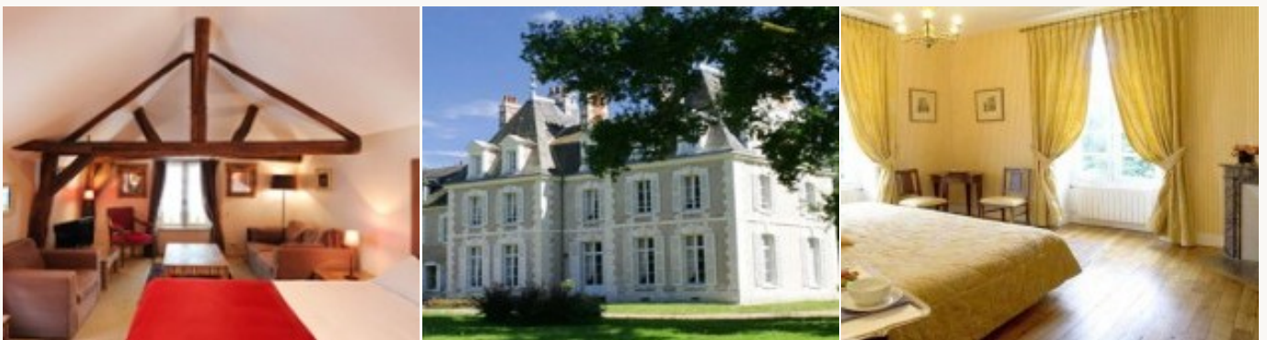
* Unterkunftbeispiel der Kategorie entsprechend

Übernachtung in kleinen Schlössern, **** Hotels oder Pensionen, wo Sie in einer außergewöhnlichen Umgebung wie ein Gott in Frankreich leben werden. Sie sind aufgrund ihres erstklassigen Service ausgesucht worden. Das Frühstück ist miteinbegriffen.