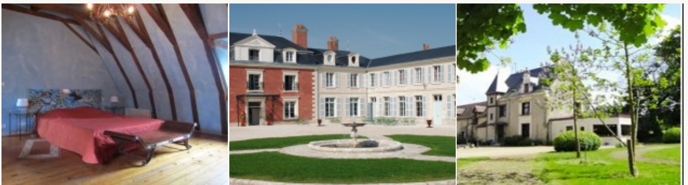
* Unterkunftbeispiel der Kategorie entsprechend

Übernachtung in Hotels auf *** Niveau oder Pensionen, die aufgrund ihres hohen Qualitätsstandards und ihres herzlichen Empfangs ausgesucht worden sind. Das Frühstück ist miteinbegriffen.