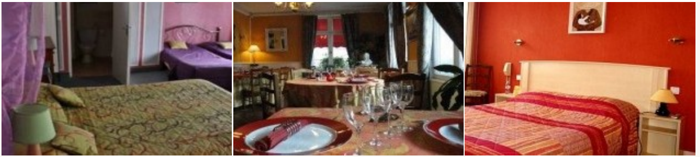
* Unterkunftbeispiel der Kategorie entsprechend