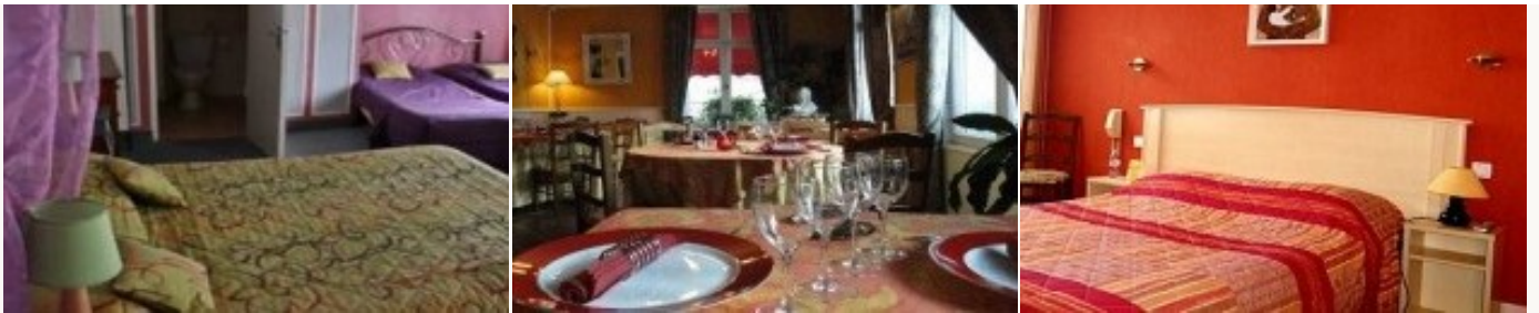
Voorbeeld van het type accommodatie