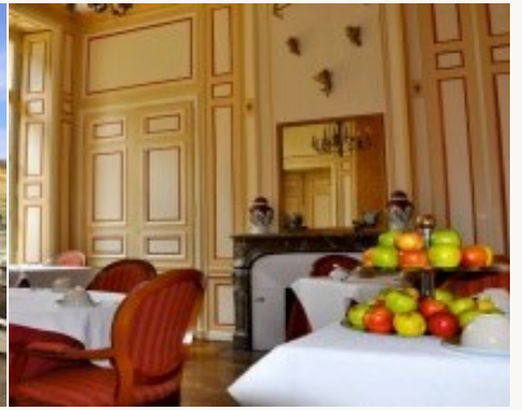
* Unterkunftbeispiel der Kategorie entsprechend