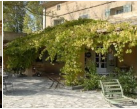
Voorbeeld van het type accommodatie