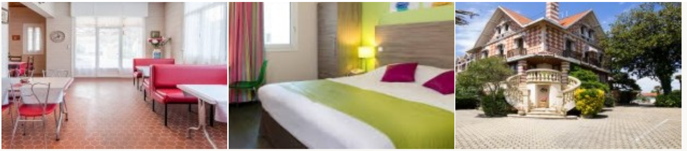
* Unterkunftbeispiel der Kategorie entsprechend