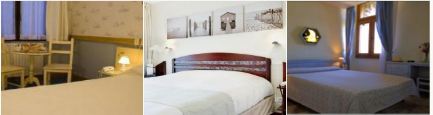
* Unterkunftbeispiel der Kategorie entsprechend

Übernachtung in Hotels meistens auf ***-Niveau. Sie genießen das Schwimmbad nach einer schönen Radtour. Das Frühstück ist miteinbegriffen.